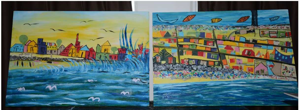
Figure 3.1 Peintures réalisées par un groupe au Sénégal

Source : Peinture réalisée par un groupe animé par Samba Sarr, photo prise par Aminata Niang.