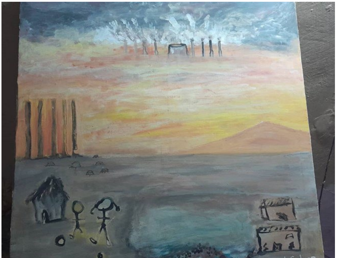
Figure 3.3 Peinture réalisée par un artiste en Mauritanie

Source : Peinture de Gabare Diop, photo prise par Haoussa Ndiaye.