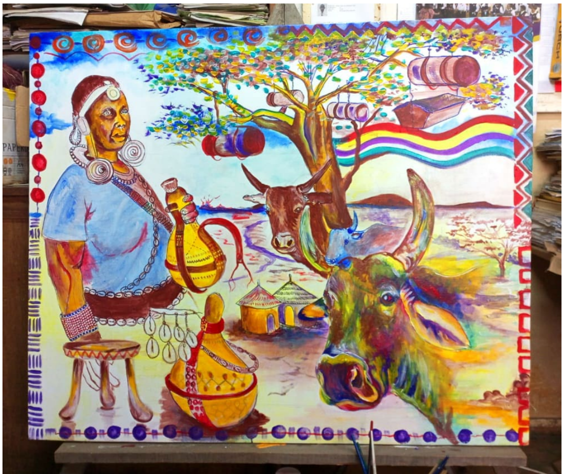
Figure 3.6 Tableau créé par un artiste au Kenya

Source : Peinture réalisée par Mutindah James, photo prise par Mutindah James.