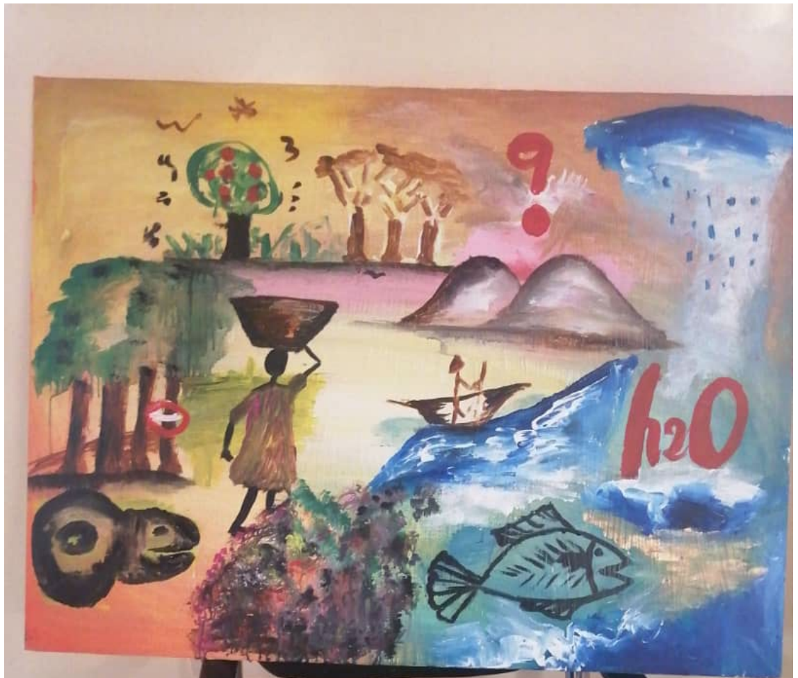
Figure 3.4 Peinture réalisée par un groupe au Mali