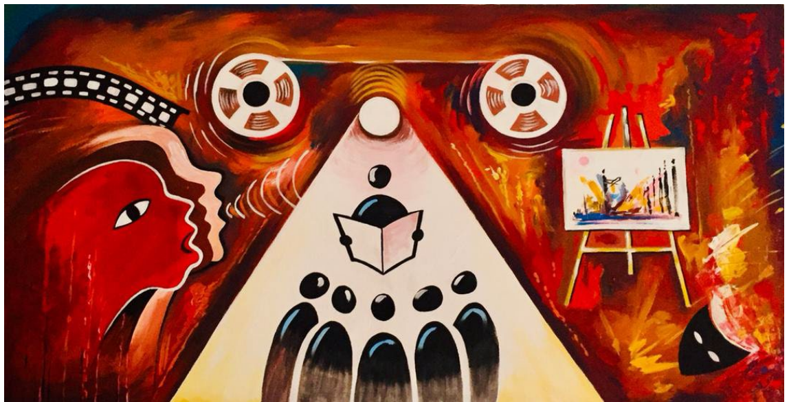
Figure 3.2 Peinture réalisée par un artiste en Mauritanie

Source : Peinture de Moctar Sidi Mohammed Alias Mokhis, photo prise par Haoussa Ndiaye.